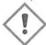
GHS 07 -Iritant

Fraze de pericol: H 319: Provoaca o iritare grava a ochilor.